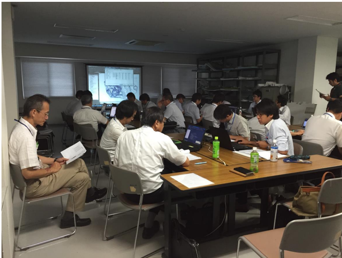
CIM 演習 第 2 部 (チームで演習しています。)

演習 2 部では、引き続き、Civil 3D を使用してサーフェスの等高線ラベル作成方法やコリドーを使った構造物掘削の地形作成について演習を行いました。