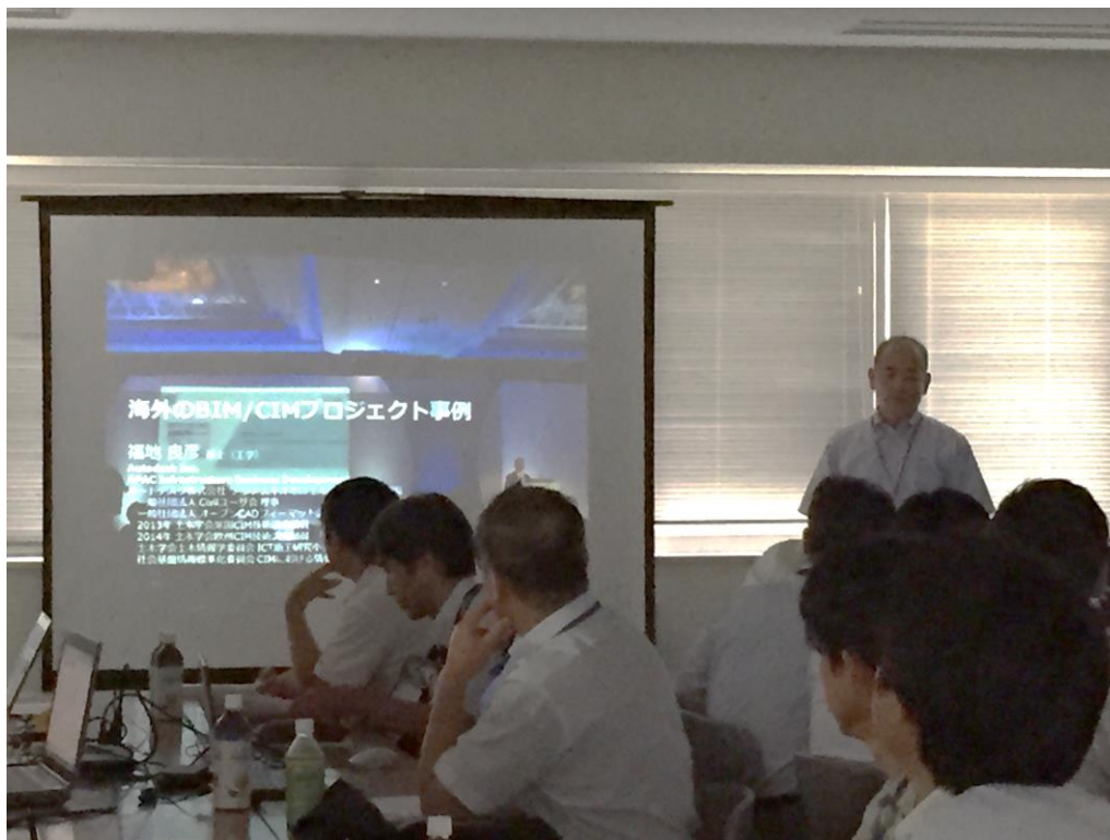
CIM 講演会の様子（真剣にスライドを見つめています。）

国内の CIM 事例では、Infracore で作成した東京全体の 3D 地形とトンネルのシールド工事や地層の表現、東京駅の駅舎モデルなど、いくつかの設計、施工状況を一つのモデルに表現されていました。広範囲のモデルを作成でき、軽快に動作するのが Infracore の特徴ですね。